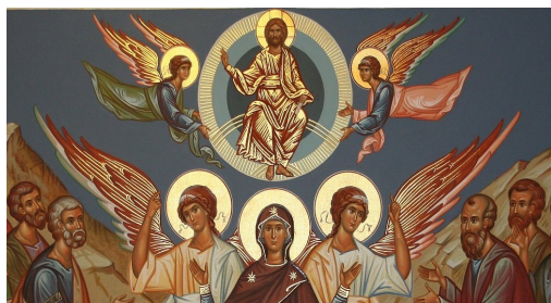
ВОЗНЕЦІННЯ Г.Н.І.Х. 25ГО ТРАВНЯ (Ю) ASCENSION OF OUR LORD MAY, 18 (G)

Заклику 2023... Однією з цілей щорічного єпархіального звернення є підтримка основних адміністративних функцій Єпархії. Наша парафія є частиною складної та розгалуженої єпархіальної мережі, що складається з 40 парафій, 3 монастирів і 7 місійних парафій. Просимо вас розглянути можливість підтримки Заклику 2023 , і цим самим дати нашій єпархії можливість постійно виконувати її основні адміністративні функції.