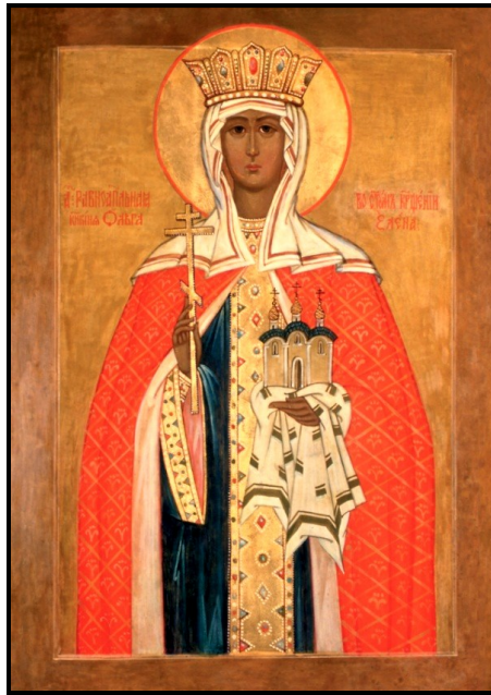
Blessed Olha, Princess of Kyiv July 11 (G)/ 24 (J) Блаженної Ольги, Княгині Київської

Наша Церква у богослуженні празника величає Ольгу такими похвалами: "Наче сонце, засяла нам твоя преславна пам'ять, Ольго богомудра, мати князів руських, Христова мізинице... Ти наша велич і похвала, Ольго богомудра, бо тобою ми визволилися від ідолського обману... Сильна наче лвиця, одягнена силою Святого Духа... Чиста наставнице закону й учителько Христової віри, прийми похвалу від недостойних рабів, і молися до Бога за нас, що свято празнуємо твою пам'ять".